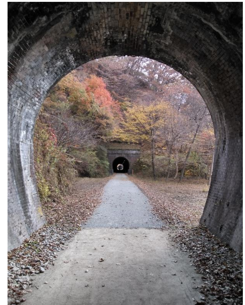
トンネルが続くアプトの道

三年ぶりに開催された雁の会トレッキングは、秋晴れのもと、群馬県の碓氷峠にある「アプトの道」を歩きました。 明治初期に作られた鉄路が今は遊歩道として整備されています。