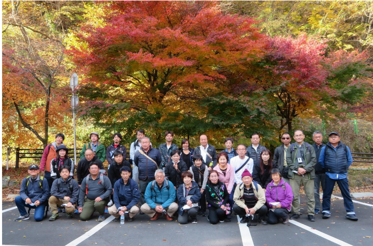
集合写真 31名の参加者が秋の碓氷峠を満喫しました。

三年ぶりに開催された雁の会トレッキングは、秋晴れのもと、群馬県の碓氷峠にある「アプトの道」を歩きました。 明治初期に作られた鉄路が今は遊歩道として整備されています。