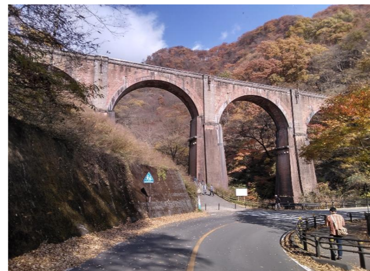
碓氷第三橋梁（めがね橋）